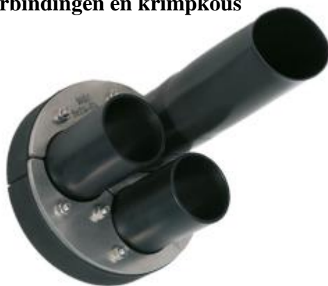
HDA 150/G/1/3x60 IKS