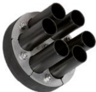
HDA 150/G/1/6x40 IKS