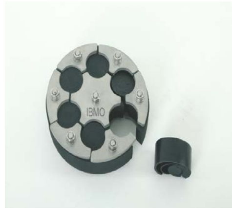
HDA 150/G/1/6x40WS IKS